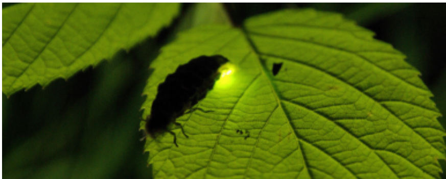
Leuchtendes Glühwürmchen-Weibchen ( Grosser Leuchtkäfer, Lampyrus noctiluca ).